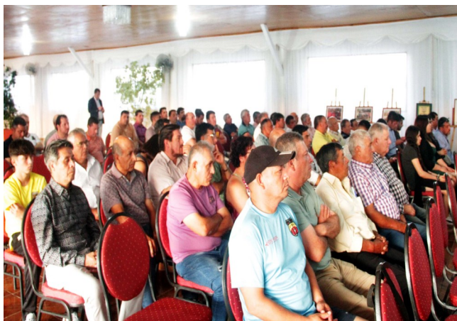
PARTE DE LA GRAN ASISTENCIA A LA CEREMONIA

DESTACAR TAMBIEN LA PRESENCIA DEL DIRECTORIO NACIONAL DE ANFA.