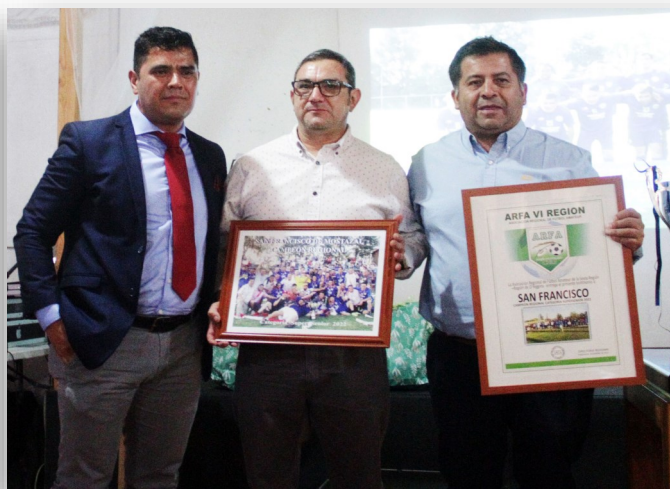
SAN FRANCISCO DE MOSTAZAL CAMPEON REGIONAL SUPERSENIOR REPRESENTARÁ A LA REGION EN EL NACIONAL DE MOLINA, REGION DEL MAULE