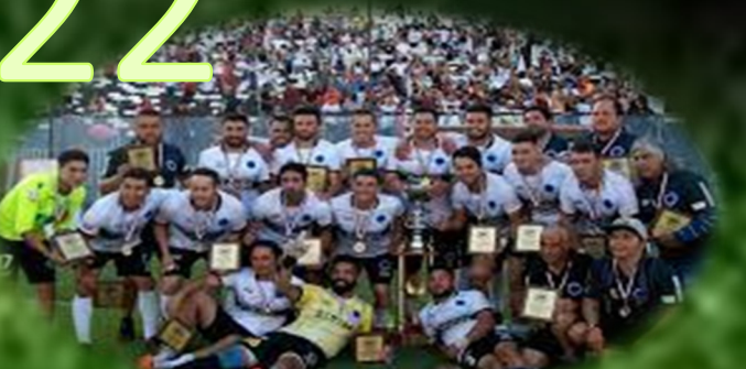
CONDOR DE PICHIDEGUA

CAMPEONES REGIONALES Y CONDOR DE PICHIDEGUA CAMPEON NACIONAL DE CLUBES 2022