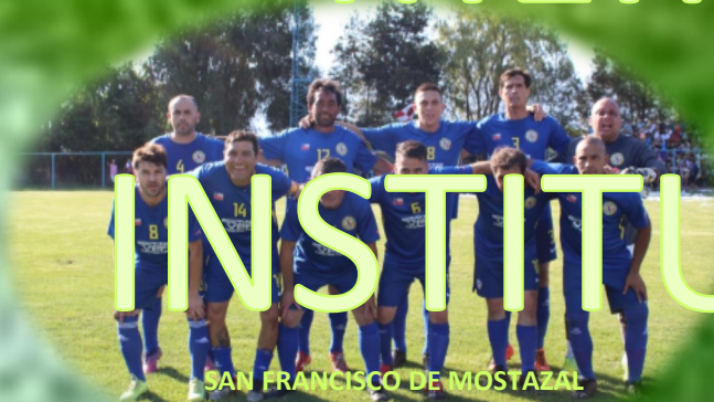
SAN FRANCISCO DE MOSTAZAL