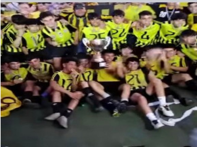
SELECCIÓN PRIMERA INFANTIL DE DOÑIHUE CAMPEON REGIONAL 2022