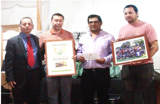
REAL SAN MARTIN DE SAN FERNANDO CAMPEON REGIONAL SUPER DORADOS