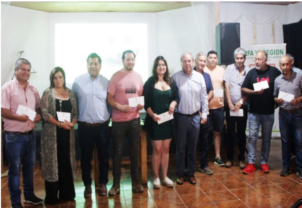
REEMBOLSOS POR GESTION JUGADORES