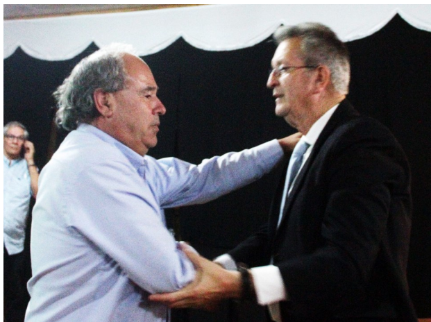
FELICITACIONES DE ANFA A ARFA VI REGION