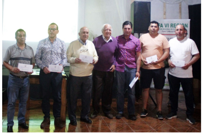
REEMBOLSOS POR DERECHOS FORMATIVOS