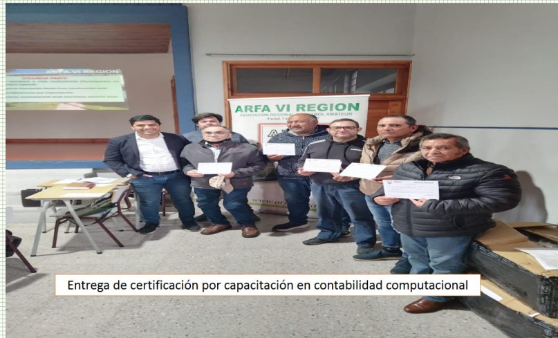
Entrega de certificación por capacitación en contabilidad computacional

Para fortalecer las instituciones hay que empezar fortaleciendo las personas.