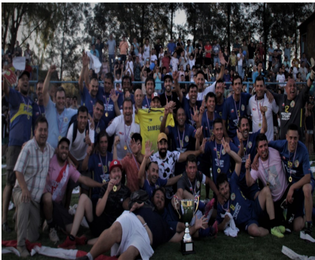
SELECCIÓN SUPERSENIOR DE SAN FRANCISCO DE MOSTAZAL, CAMPEON REGIONAL 2022