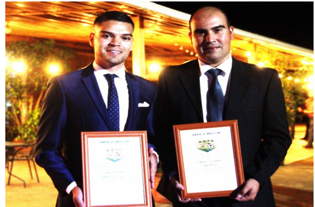
RECONOCIMIENTO ARBITROS DESIGNADOS A LOS NACIONALES