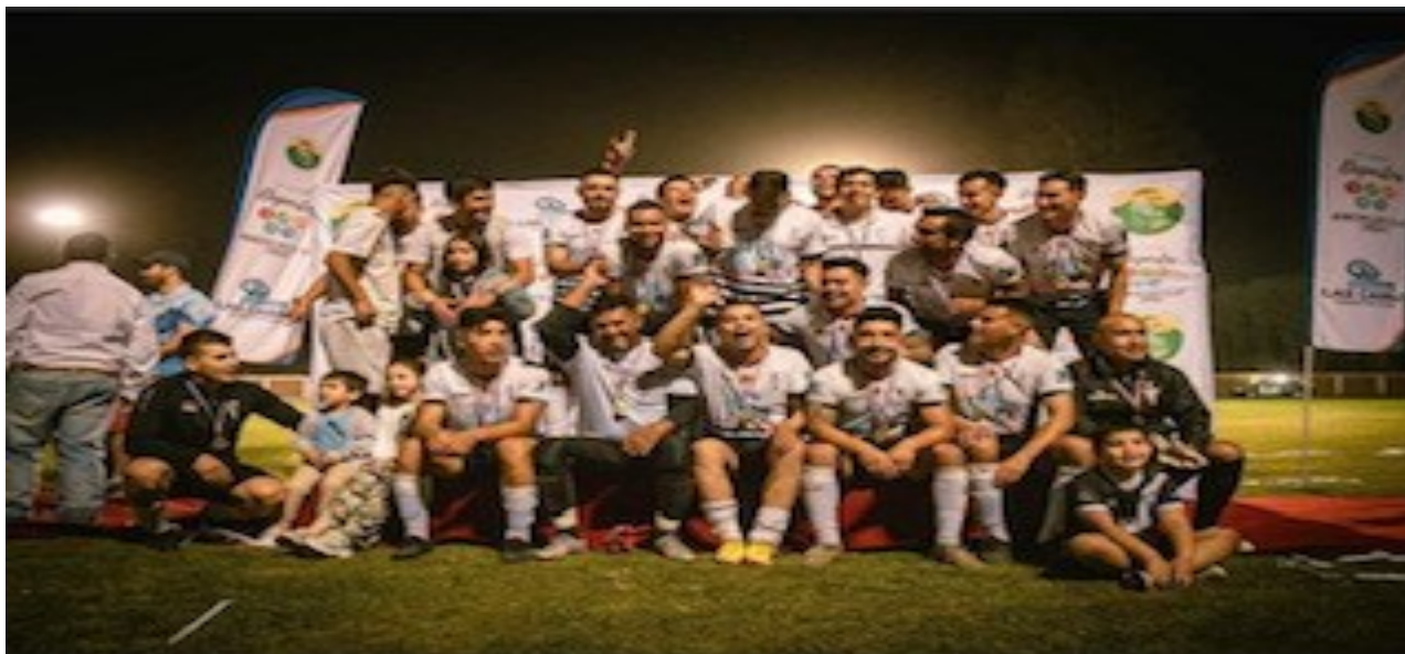
CLUB DEPORTIVO FERROVIARIO COMERCIAL DE LAS CABRAS CAMPEON REGIONAL 2022

La versión N° 36 del Torneo Regional de Clubes hubo de suspenderse por dos grandes razones, el año 2020 y 2021 por la amenaza de la pandemia y el año 2022 por las debilidades internas; la indisciplina, la violencia y el desacato, que hicieron aconsejable la suspensión del torneo como medida precautoria.