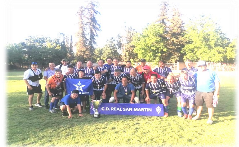
REAL SAN MARTIN DE SAN FERNANDO CAMPEON 2022