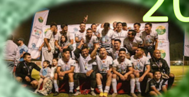
FERROVIARIO COMERCIAL LAS CABRAS