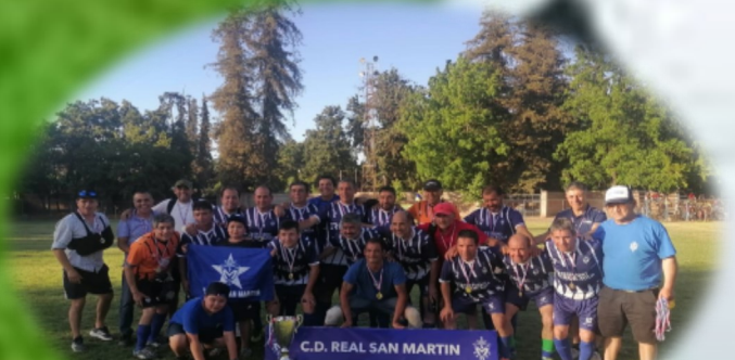
REAL SAN MARTIN DE SANFERNANDO