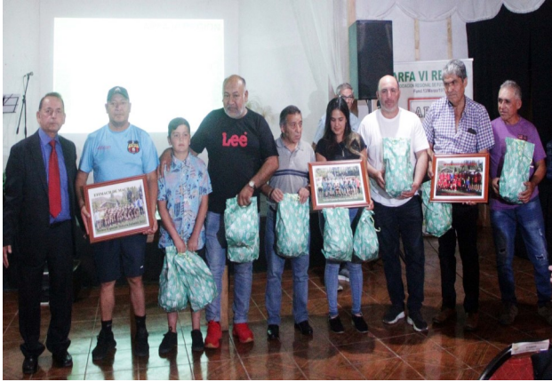
PREMIACION TERCERA INFANTIL