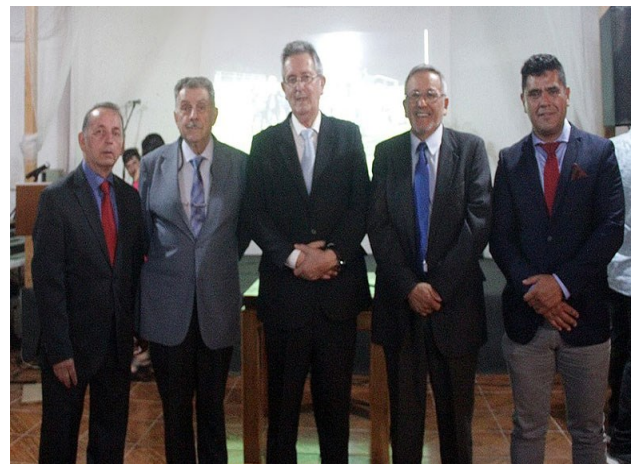
Directorio Regional 2022-2026