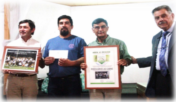
FERROVIARIO DE LAS CABRAS CAMPEON REGIONAL DE CLUBES