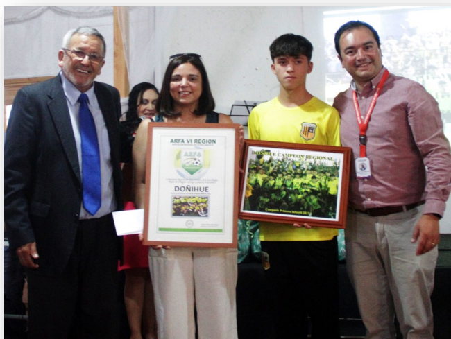
DOÑIHUE CAMPEON REGIONAL PRIMERA INFANTIL REPRESENTARÁ A NUESTRA REGION EN EL NACIONAL DE CASTRO