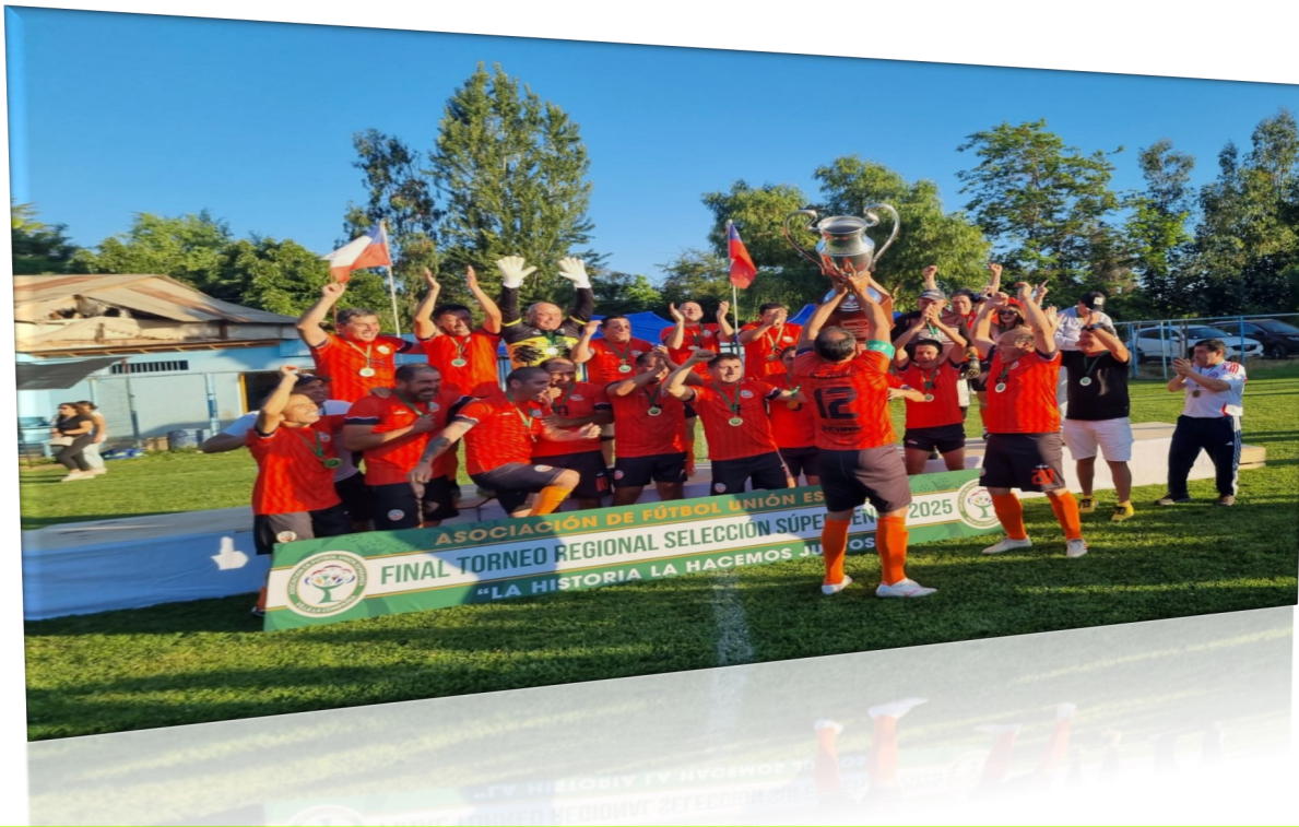
SELECCIÓN SUPERSENIOR DE PEUMO, CAMPEON REGIONAL 2026

PEUMO SE INSCRIBIÓ COMO EL FLAMANTE CAMPEON REGIONAL EN CATEGORÍA SUPERSENIOR, EN UNA COMPETENCIA REGIONAL QUE CONVOCÓ A 22 SELECCIONES PARTICIPANTES, EL EQUIPO PEUMINO REPRESENTARÁ A NUESTRA REGION EN EL CAMPEONATO NACIONAL QUE SE JUGARÁ EN LA REGION DE AYSÉN, EN ENERO DE 2026.