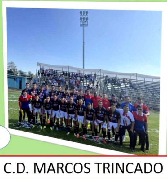
C.D. MARCOS TRINCADO

Participaron en esta versión 56 clubes, con un total aproximado 1680 jugadores, sin duda una competencia de alta convocatoria.