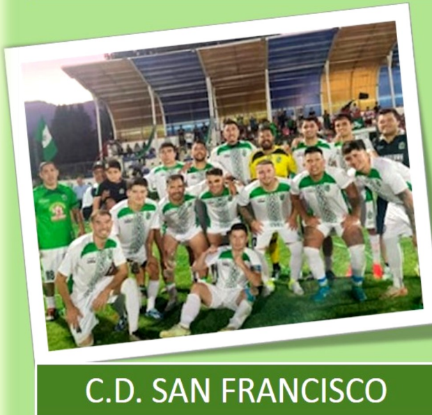
C.D. SAN FRANCISCO