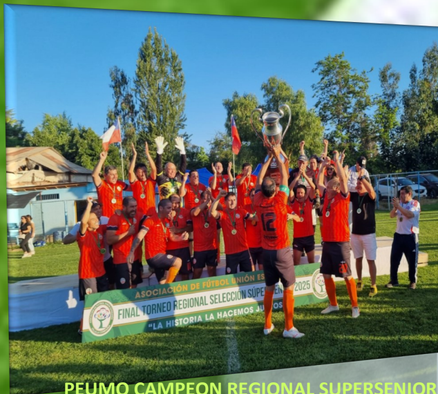
PEUMO CAMPEON REGIONAL SUPERSENIOR